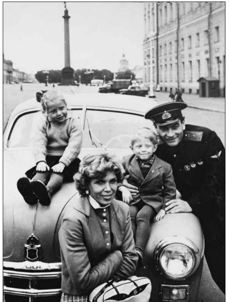
На съемках фильма «Балтийское небо»