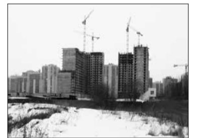
Так выглядит Литориновая улица сегодня

По другую сторону новой улицы, на верхней террасе, компания «Ойкумена» возводит жилой комплекс «Граффити». Это будет дюжина 24-этажных жилых домов, расставленных плотно друг к другу, обычно такие кварталы называют «муравейниками». Квартал ограничен проспектом Королева, Шуваловским проспектом, Парашютной улицей и пока безымянным проездом по Литориновому уступу.