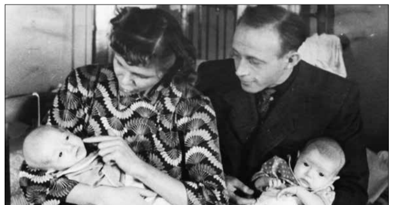
г. Куйбышев, 1956 год