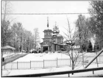
Димитриевская церковь на уступе

А вот что сообщала газета «Северная Пчела»: «Вид с де-