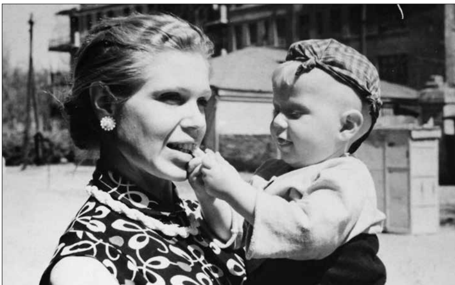
Одесса, демонстрация 1 мая, 1957 год