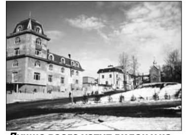
Лучше всего уступ виден у часовни Александра Невского

Новая улица Приморского района пройдет по трассе старой дороги от Шуваловского проспекта до Мартыновского сквера, неподалеку от «Юбилейного квартала». Она станет одной из самых извилистых