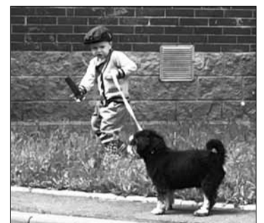
Цвергшнауцер, считающий позорным справлять нужду на асфальте

По словам одного опытного собаковода, многие его знакомые и рады бы убирать за своими питомцами, но по требованиям санэпидемстанции нельзя выкидывать отходы в урну, даже в полиэтиленовых пакетах. Для собачьих экскрементов должны быть установлены специ-