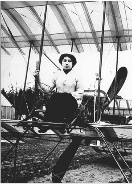
Лидия Зверева на Фармане IV